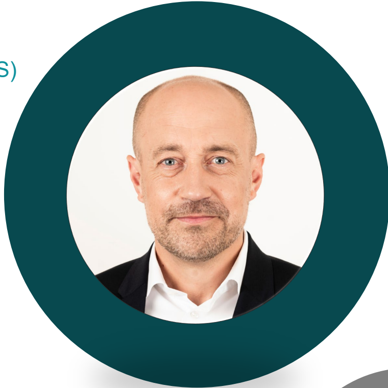
Miljøministeriet Magnus Heunicke (S)