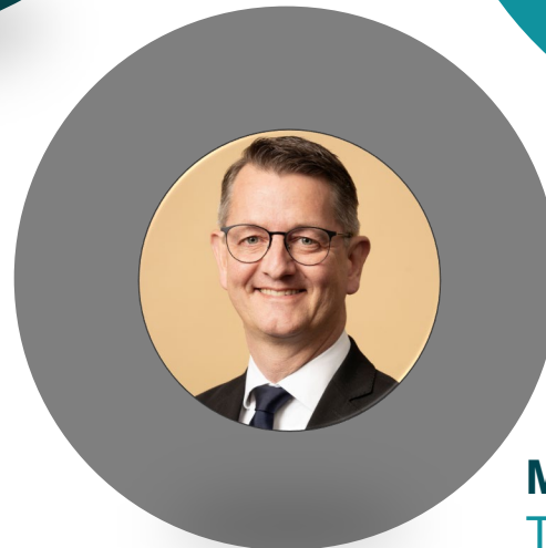
Ministeriet for Samfundssikkerhed og Beredskab Torsten Schack Pedersen (V)