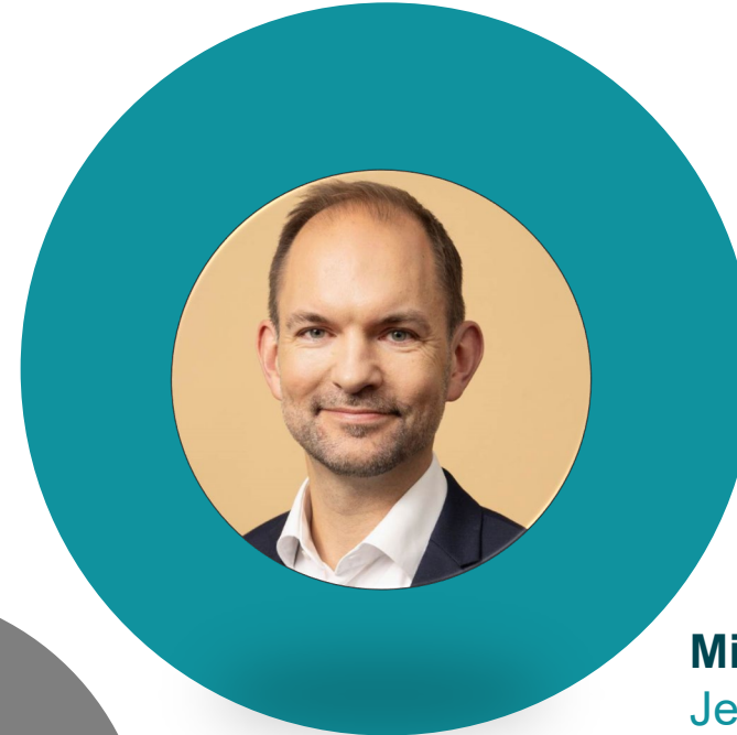
Ministeriet for Grøn Trepert Jeppe Bruus (S)